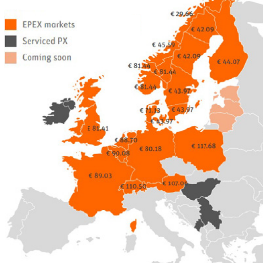
EPEX prijzen van EEX-spot landen

Als er prijsverschil tussen de landen is, is er dus een beperking op de interconnectie. De dagvooritprijs staat steeds meer onder invloed van de Duitse, Belgische en Franse markt doordat de systeemoperators steeds meer interconnectie aanleggen. In de bijgevoegde afbeelding is te zien dat op deze dag de gemiddelde prijs in België 90 euro/MWh was, en de gemiddelde prijs in Nederland 88 euro/MWh.