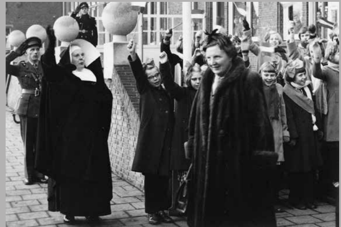
Koningin Juliana wordt toegejuicht door kinderen en non op het Stationsplein te Roosendaal, 22 december 1955.