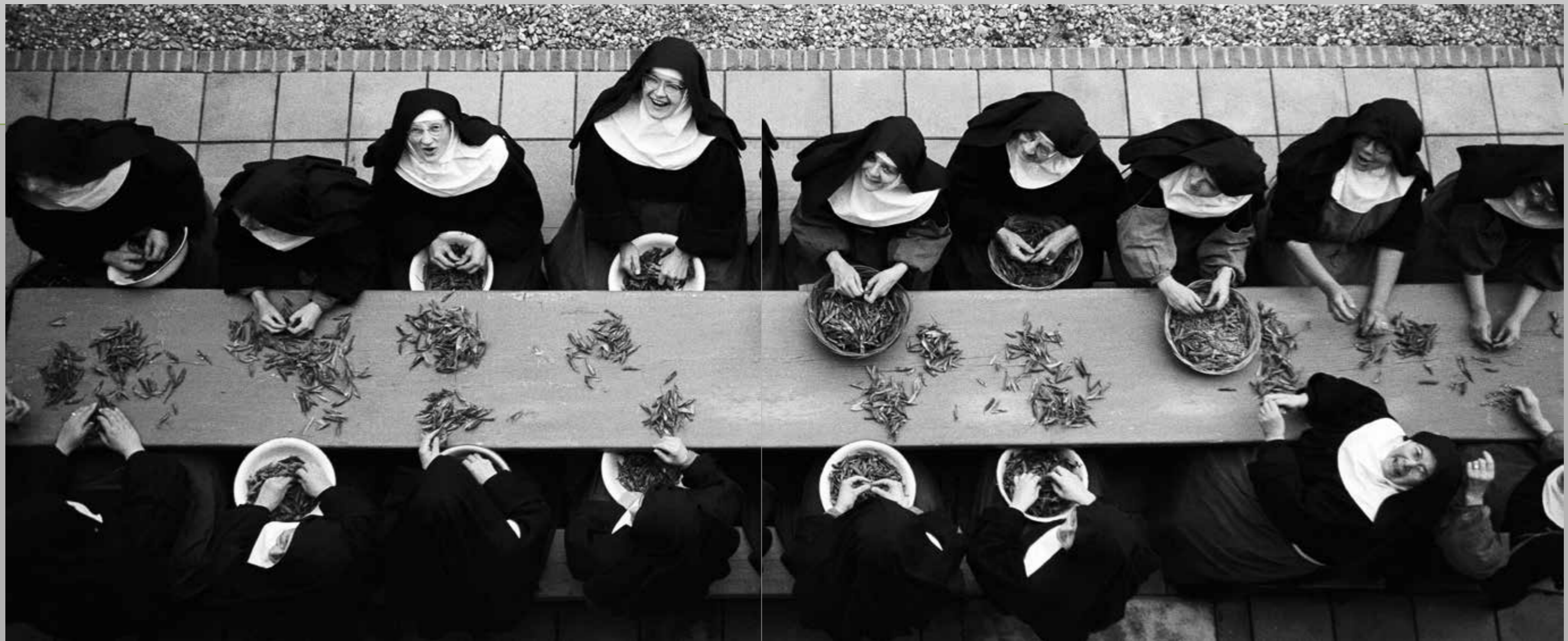
Boontjes doppende clarissen Megen, 1961.