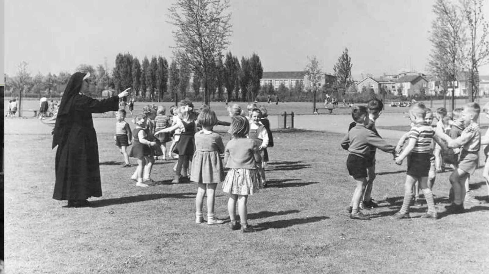
Kinderen dansen in een kring onder begeleiding van een zuster in het Zuiderpark te 's-Hertogenbosch, eind jaren '50 - begin jaren '60 Franciscanessen van Charitas, Roosendaal, 1965.