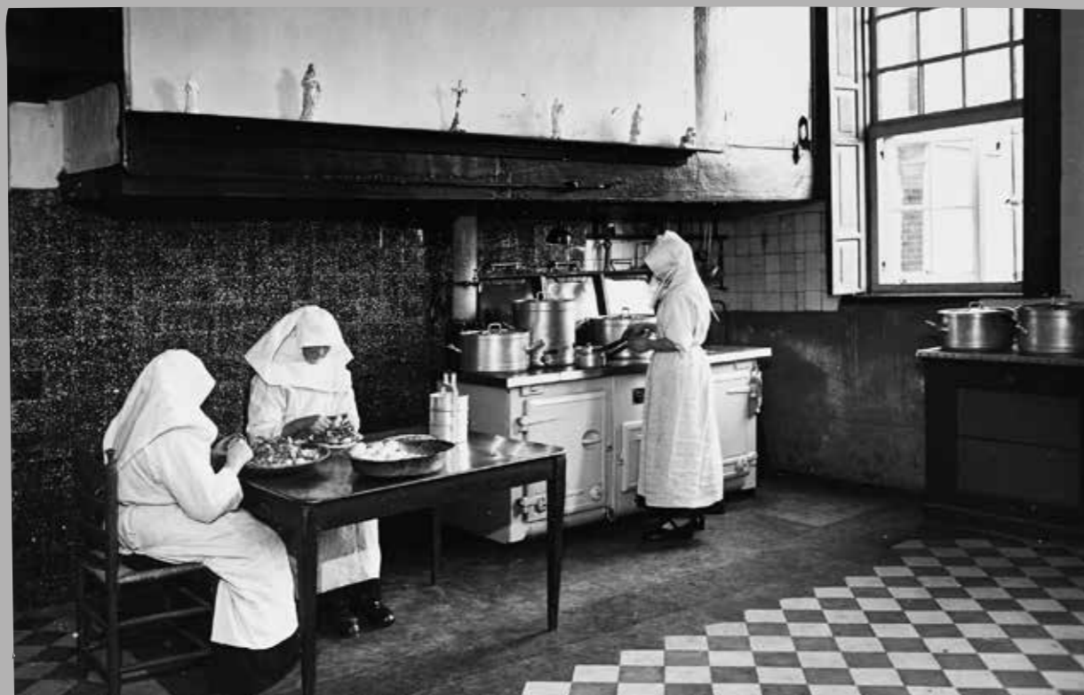
Keuken van klooster Mariendael, Sint-Oedenrode, 1951.