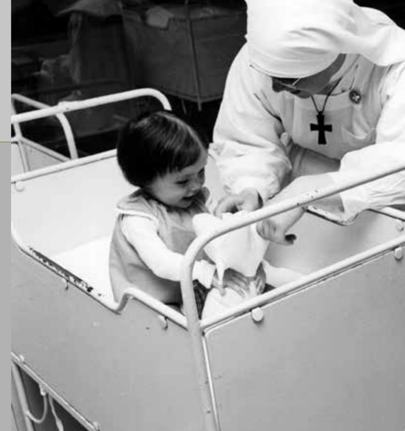
Kinderzorg door Franciscanessen van Charitas, Roosendaal, 1965.