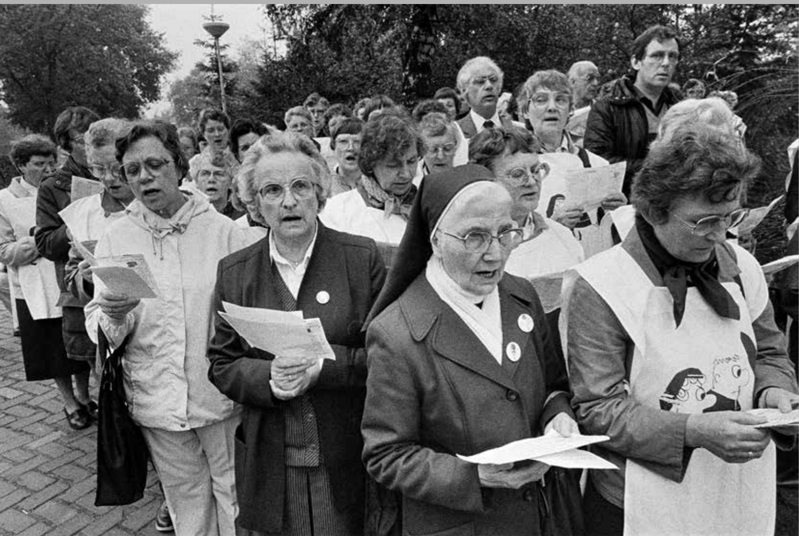
Demonstrerende zusters tegen kruisraketten, Woensdrecht, 18 mei 1984.