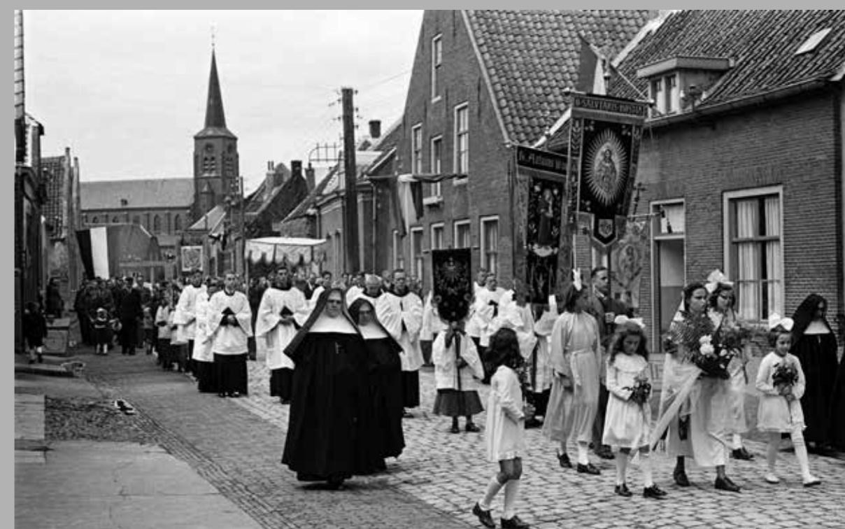
Mariaprocessie met priester onder baldakijn trekt door de straten van Megen, jaren '50-'60.