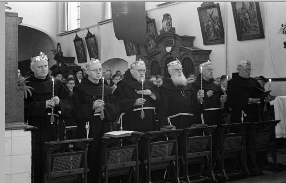
Franciscanen Patersjubilareissen met kroon en kaars in de Kloosterkerk van de franciscanen te Megen, 17 september 1952.