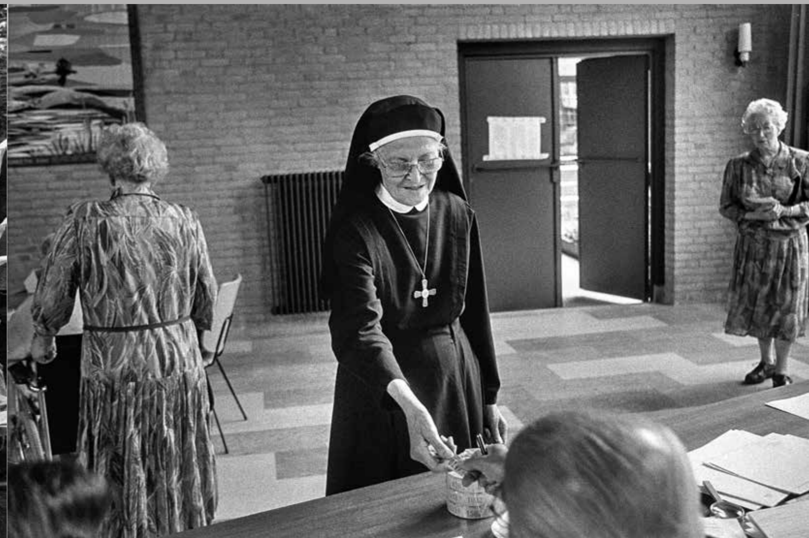
Non in het stembureau, Breda, 17 september 1994.