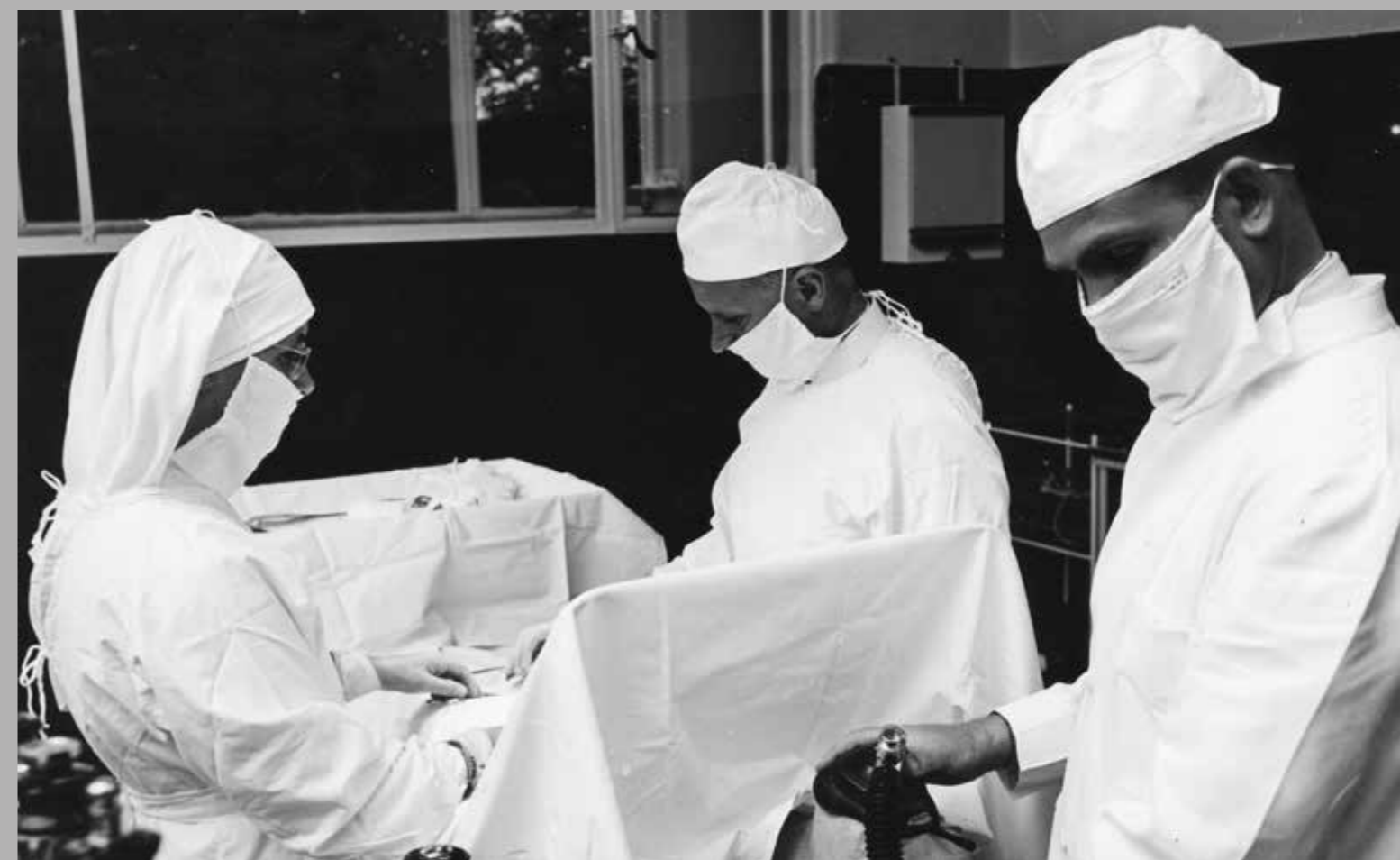
Operatie in Sint Jozefgesticht bij Franciscanessen van Charitas, Oosterhout, 1965.