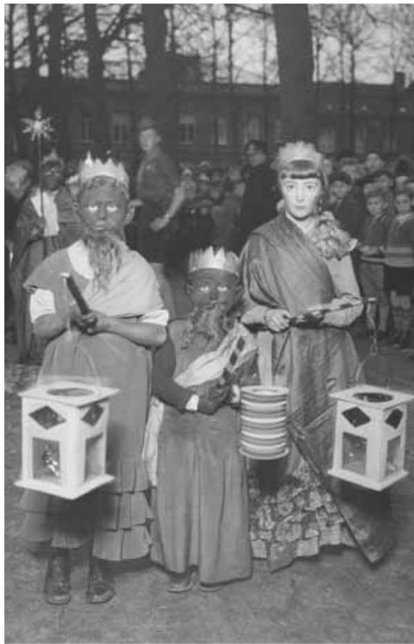
Driekoningen, driekoningen geef mij een nieuwe hoed