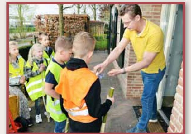
Rechtsonder: Eieren ophalen met de bolderkar in Haaren, 2022.