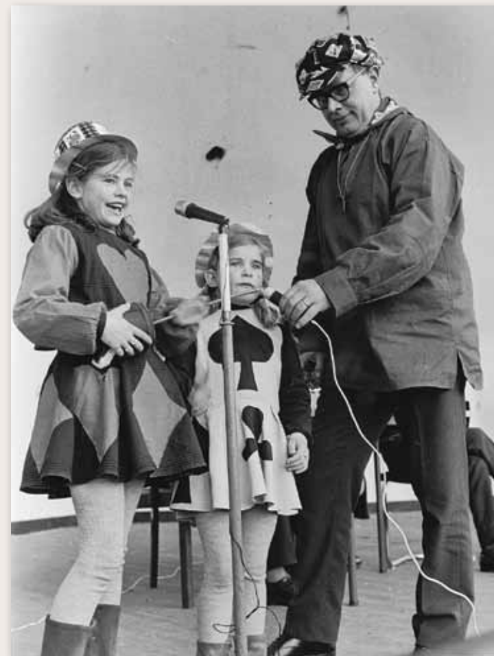
'k heb zo lang met de foekepot gelopen, 'k heb geen geld om brood te kopen, foekepotterij, foekepotterij, geef mij een oortje, dan ga ik voorbij