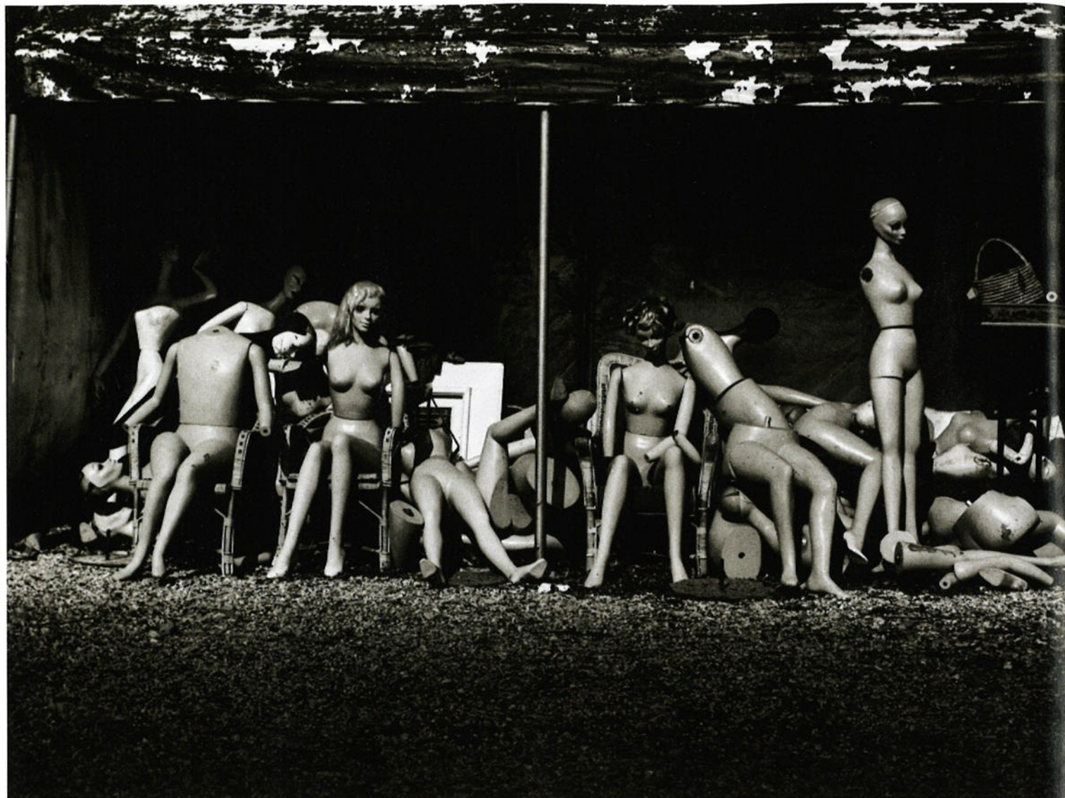
Boven: 'Na de therapie' (etalagepoppen). Rechterpagina, boven: Strabrechtse Heide bij Heeze Rechterpagina, onder: Gezicht op Wintelre.