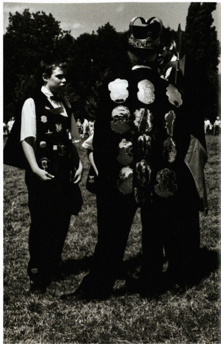
Boven, links: Laantje in de buurt van Achelse Kluis. Boven, rechts: Pronken met gildezilver tijdens de Gildedag te Vesseem in 1992. Rechterpagina, boven: Het zandpad Roerdomp bij Gastel. Rechterpagina, onder: Oude boerderij in buurtschap Postels Huufke, Vesseem.

als Coppens koos Guntlisbergen mensen met markante koppen als onderwerp, evenals ambachtslieden, werkende boeren op het platteland, maar ook oude boerderijen, kapellen en de natuur. Een keer zoomde hij in op een groepje bosarbeiders bij een vuurtje. "Hij moest de mannen eerst een pak shag geven voordat hij een foto mocht maken", memoreert Tjabine.