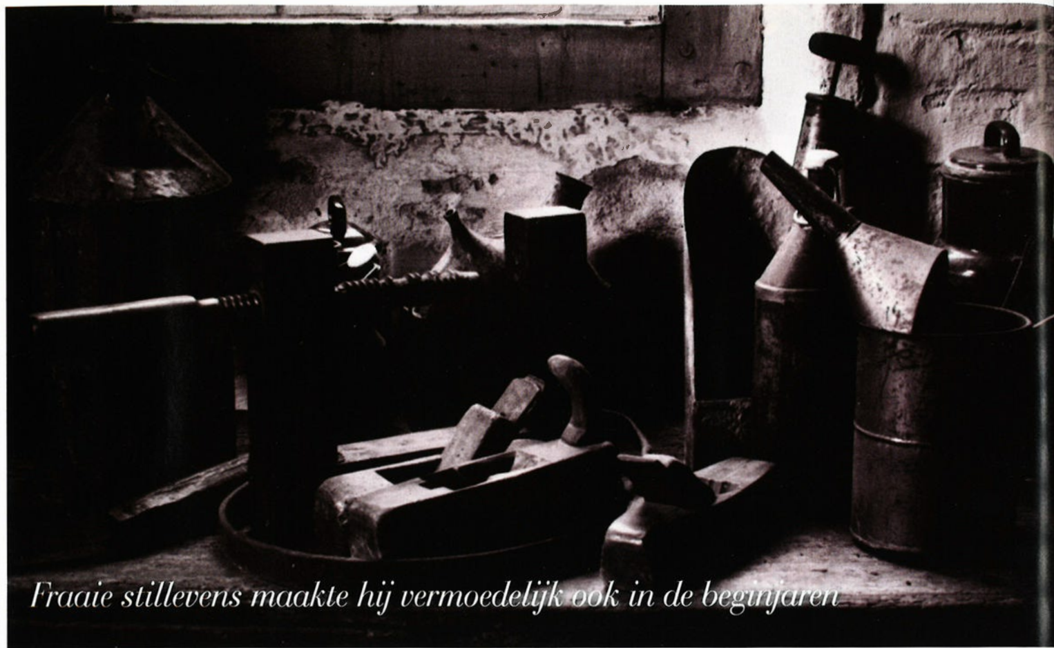
Fraaie stillevenen maakte hij vermoedelijk ook in de beginjaren