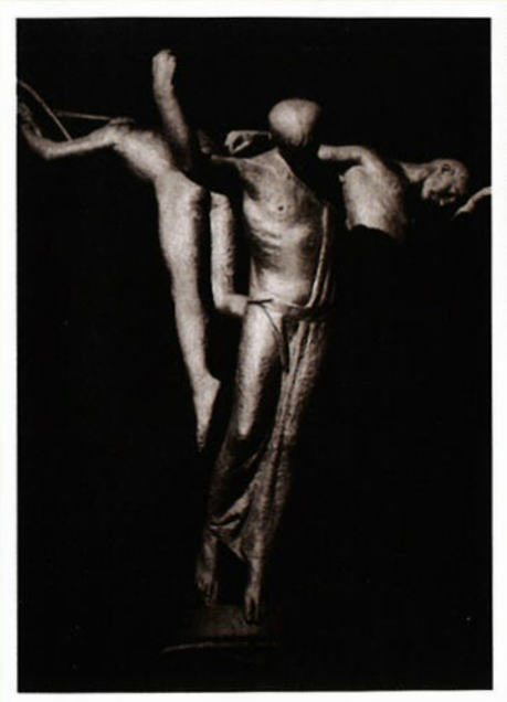
Rechts, onder: Bevrijdingsmonument, Eindhoven.