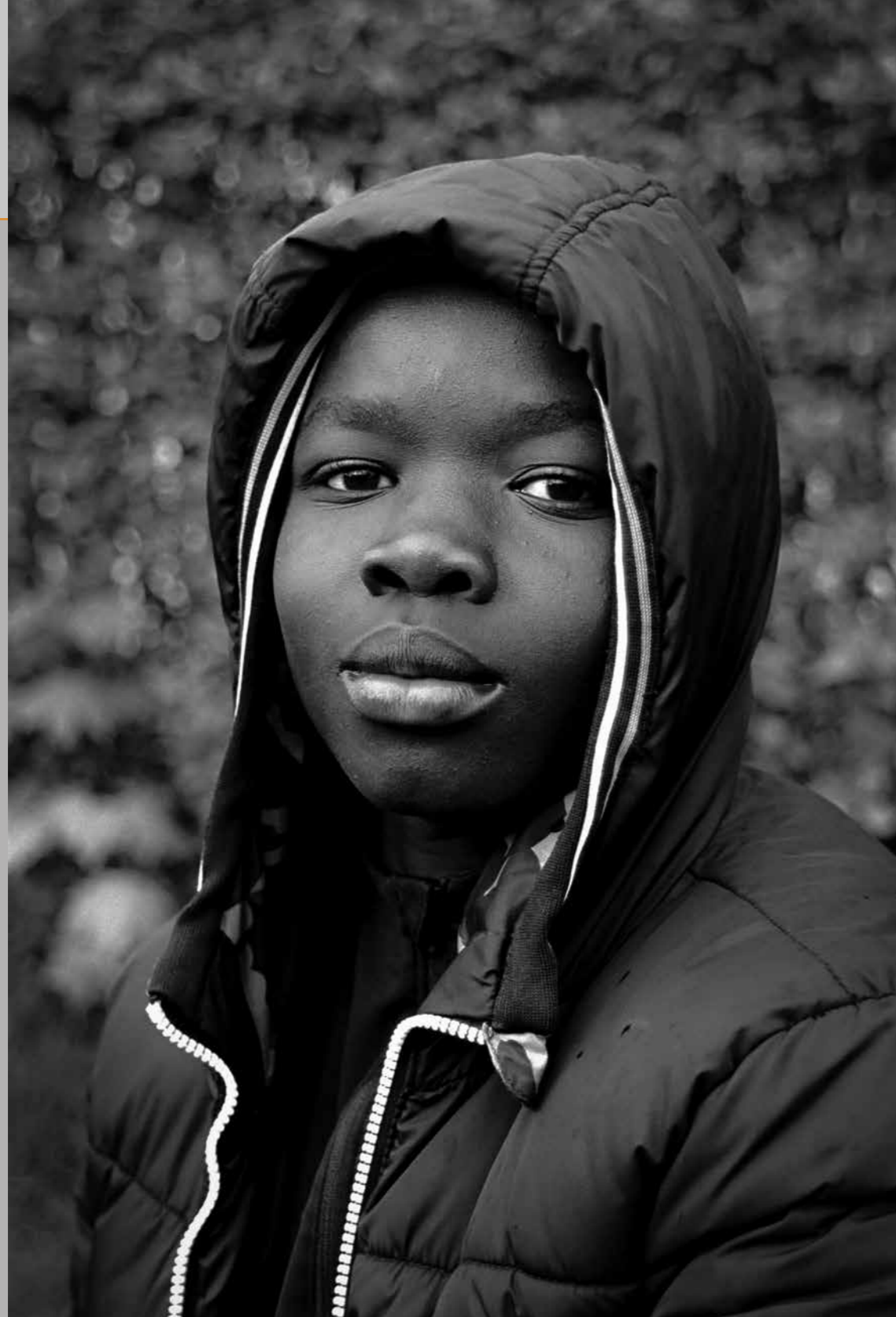
Portret, Oisterwijk, 2023.