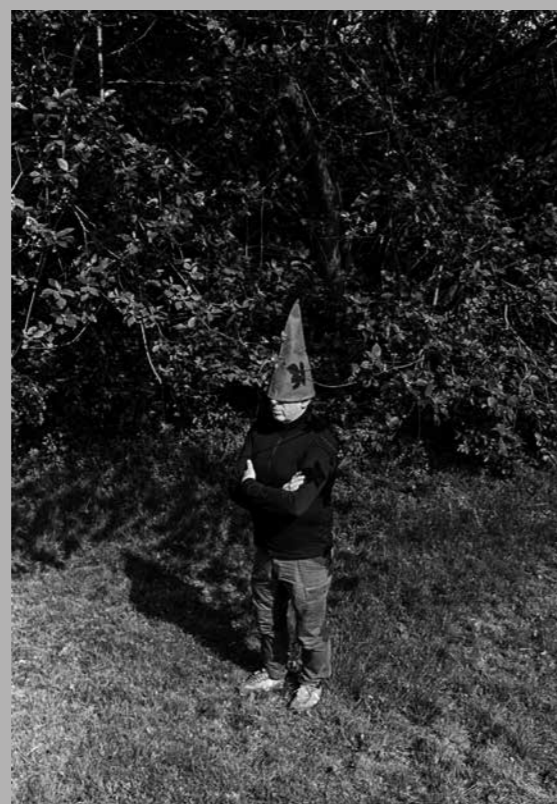
Rechts: Wit paard, Ommel, 2023.