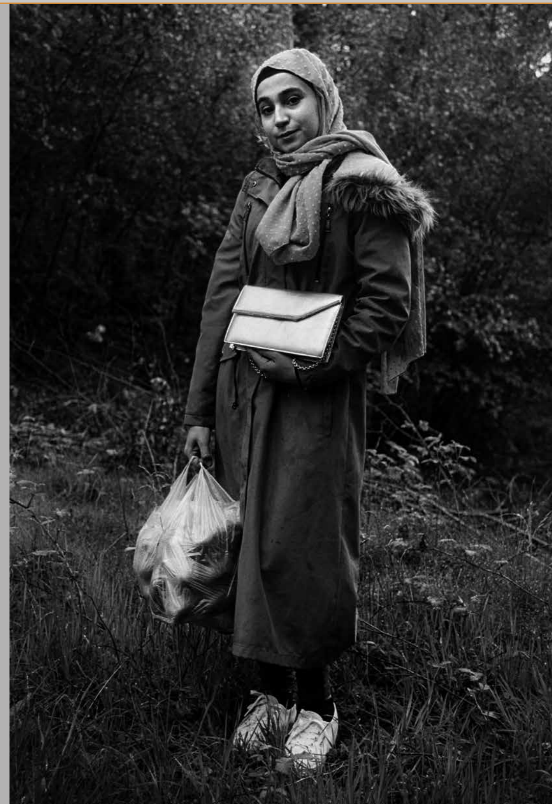
Rechts: Dochter van Mohammed 1, Oisterwijk, 2023.