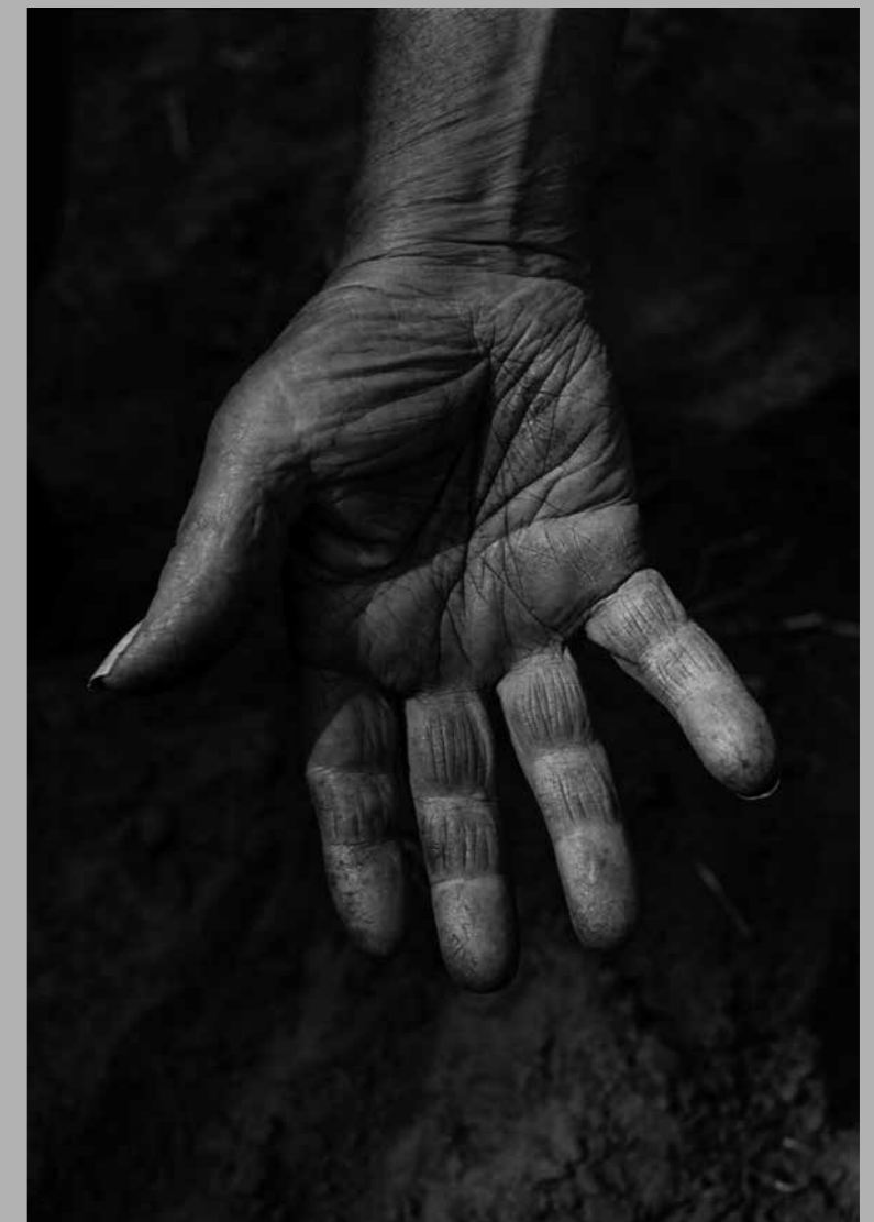
Hand, Helenaveen, 2023.