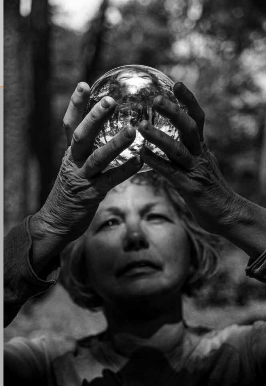
Linksonder: Huis, Ommel, 2023. (Foto: Wiesje Peels. De Mix Nederland 'Aarde' | stichting Beeldmix) Rechtsonder: Peelkabouter, Ospel, 2023. (Foto: Wiesje Peels. De Mix Nederland 'Aarde' | stichting Beeldmix)