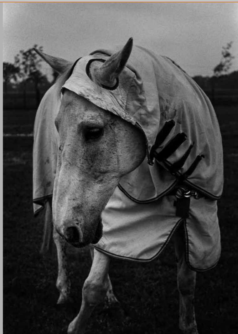
Ridderpaard, Spoordonk, 2023. (Foto: Wiesje Peels. De Mix Nederland 'Aarde' | stichting Beeldmix)