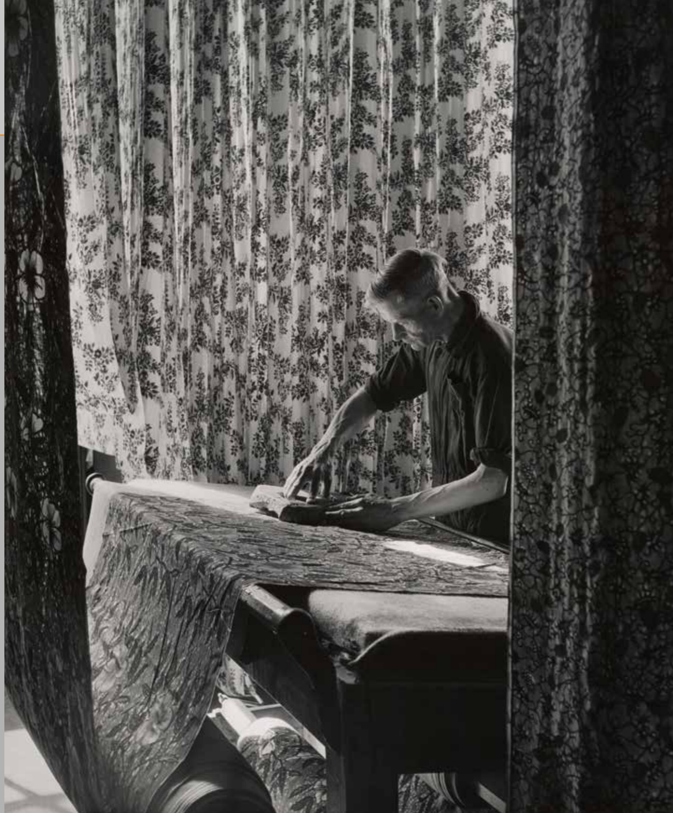
Katoen bedrukken met stempel bij Vlisco, Helmond, 1953.