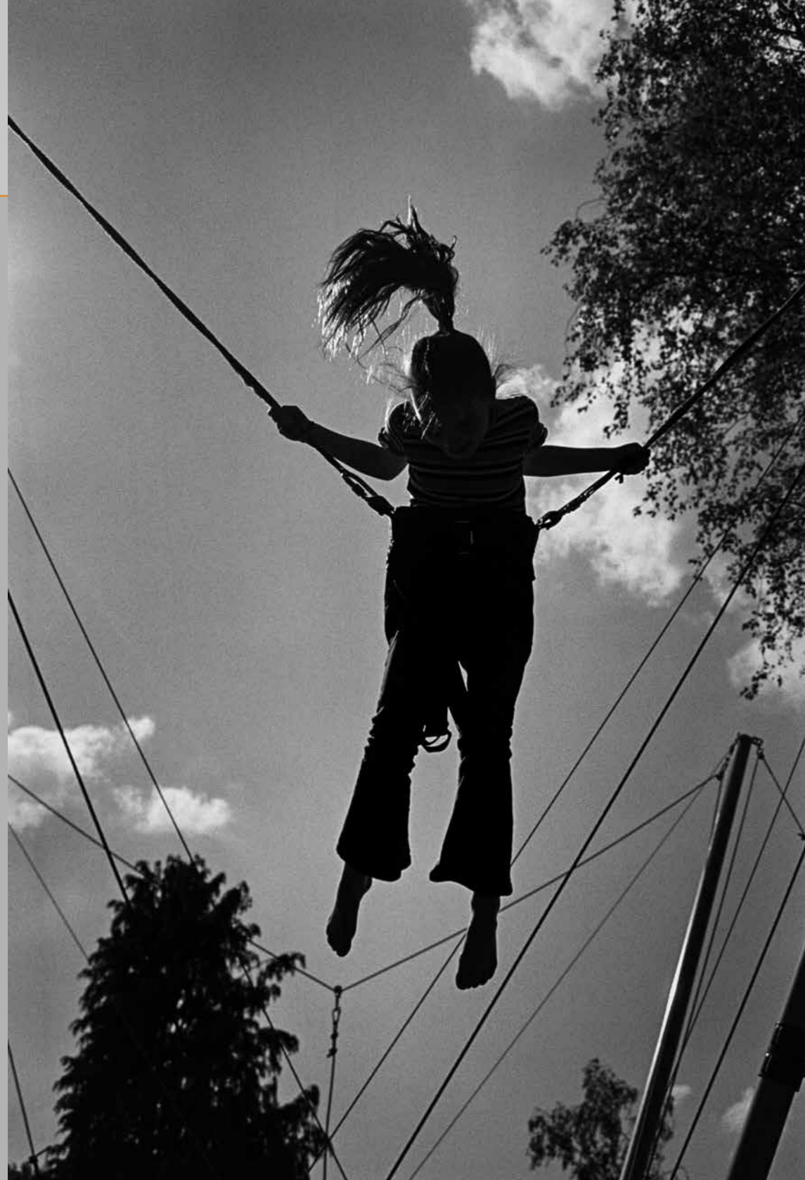
Loskomer, Vlierden, 2023. (Foto: Wiesje Peels. De Mix Nederland 'Aarde' | stichting Beeldmix)