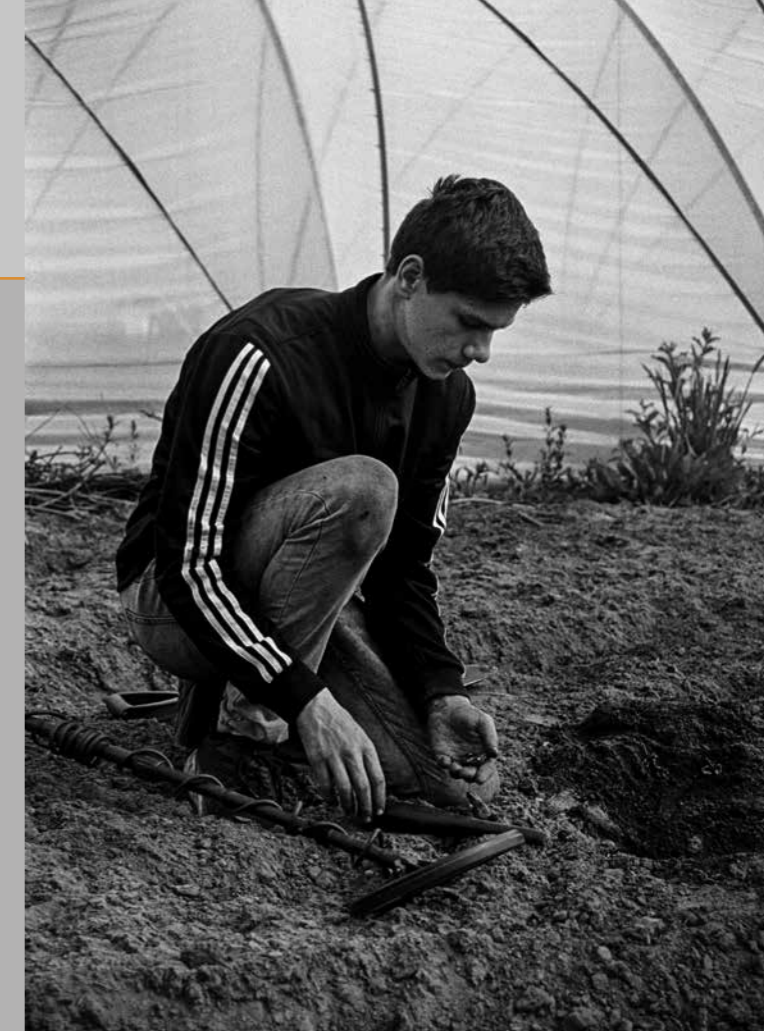
Zoeker, Liessel, 2023. (Foto: Wiesje Peels. De Mix Nederland 'Aarde' | stichting Beeldmix)