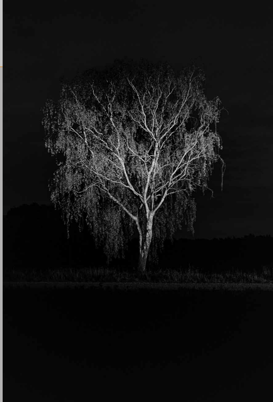
Treurboom, Ommel, 2023.