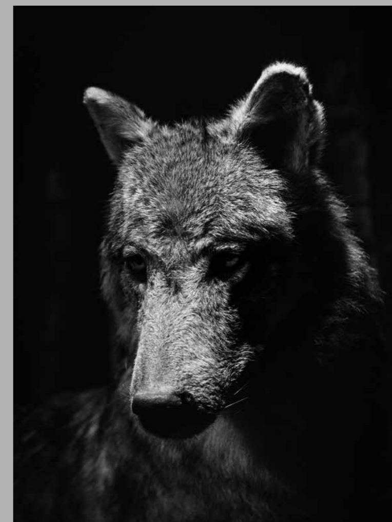
Wolf, Asten, 2023.