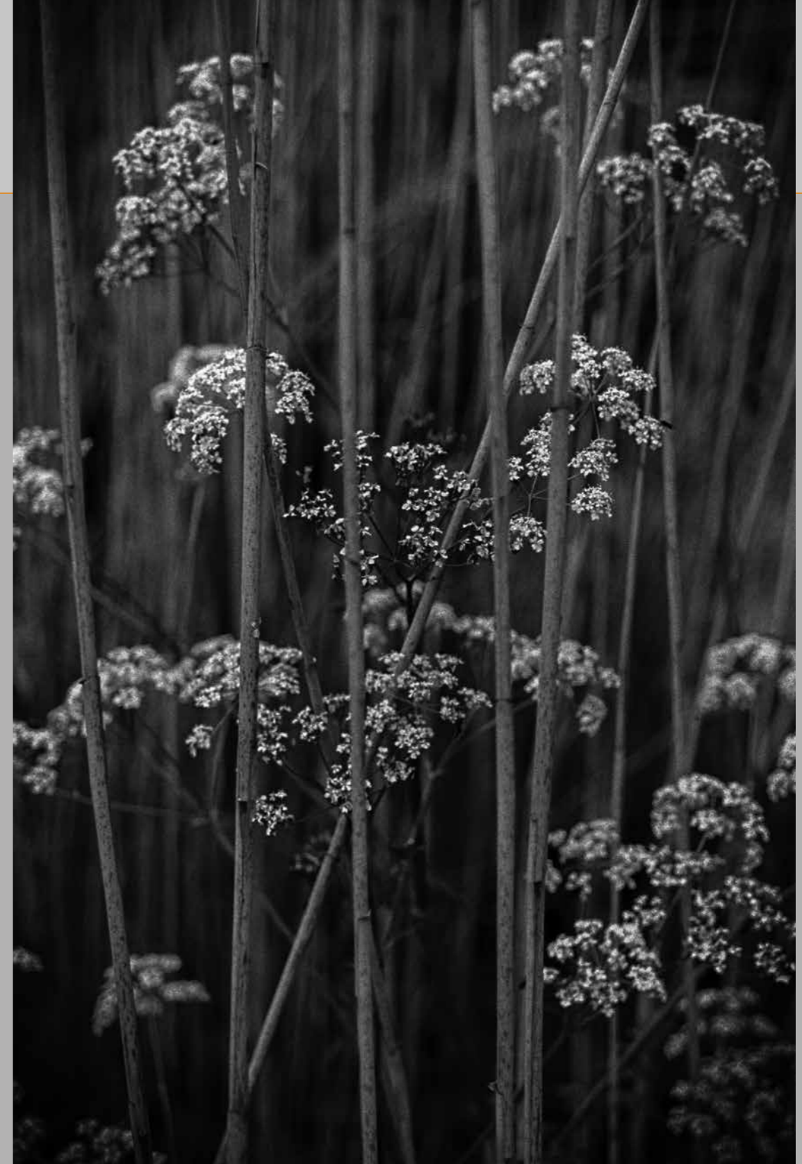
Fluitenkruid, Kampina, 2023.