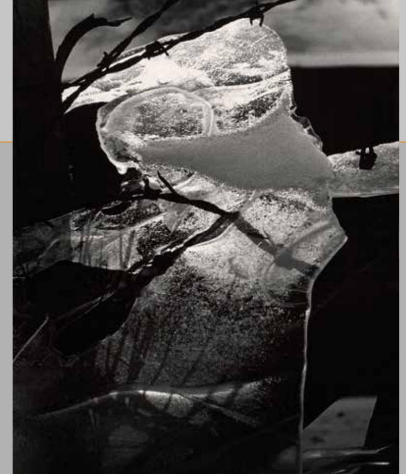
Restant ijs aan prikkeldraad en weidepaal in het Dommeldal, circa 1955-1960.