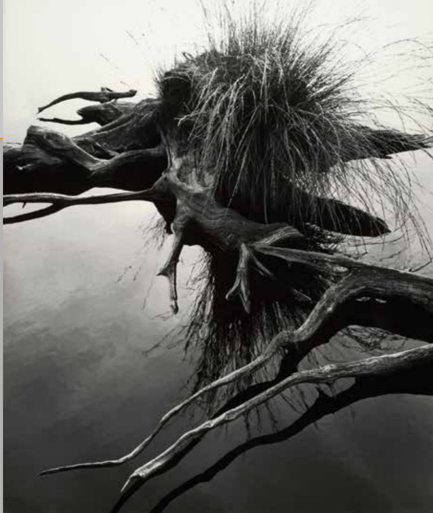
Kienhout met graspol in ven, De Peel, circa 1952.