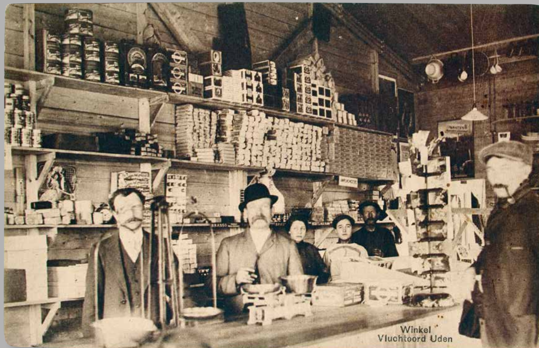
Onder: Interieur van de winkel in Vluchtoord Uden voor Belgen tijdens de Eerste Wereldoorlog, 1914. Uitg. Grafische Kunstinrichting C. Uiterwijk, Rotterdam. (Fotograaf onbekend. Prentbriefkaart. Brabant-Collectie, Tilburg University)